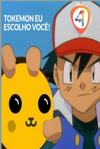
Tokenon, use the Thunder Shock now!

The TKM MANIA represents a marketing, advertising and publicity plan to the TKM through of memes, parodies and several activities used to promote the TOKEMON in the Brazilian and worldwide community.